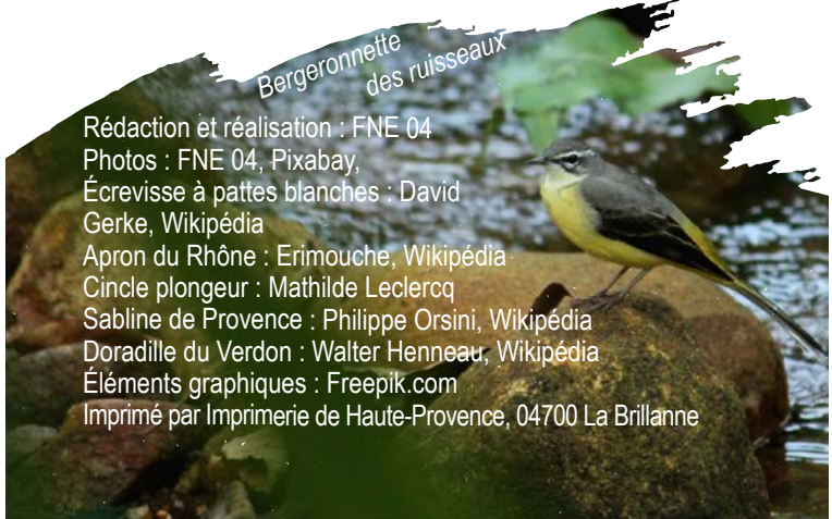
Bergeronnette des ruisseaux

Rédaction et réalisation : FNE 04 Photos : FNE 04, Pixabay, Écrevisse à pattes blanches : David Gerke, Wikipédia Apron du Rhône : Erimouche, Wikipédia Cincle plongeur : Mathilde Leclercq Sabline de Provence : Philippe Orsini, Wikipédia Doradille du Verdon : Walter Henneau, Wikipédia Éléments graphiques : Freepik.com Imprimé par Imprimerie de Haute-Provence, 04700 La Brillanne